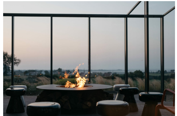
Hôtel La Butte

Bains d'énergie et de minéraux, on fait le plein en version iodée ou chlorophyllée. A Ouessant, on mise sur la méditation en pleine conscience au Sport Ouessant & Spa, inspiré de l'architecture traditionnelle ouessantine. A l'hôtel restaurant & spa La Butte à Plouider, cours de yin yoga, pratique méditative et cours de Hatha yoga le tout dans un confort absolu. A 15 mn de Lorient au Manoir des Eperviers, on remet les compteurs à zéro avec une cure d'otoxolène, des étirements, sophrologie, massage et méditation. Au Sofitel Quiberon, on craque pour son offre brunch & spa, le suivi Thalasso à la maison ou ses nouveaux modelages « au bonheur du ventre ». A Roz Marine à Perros Guirec, on mise sur l'immersion Terre & Mer aux bienfaits marins « in & out » : longe-côte, marche nordique « revisitée », apnée statique complétée par des bains hydromassants, enveloppement d'algues et de boues bretonnes.