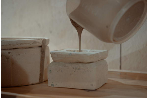
Faire son bol breton avec Bol & Cie – ExpÃ©rience bretonne

Des biscuiteries, du maritime, du portuaire, de lâ€™ostrÃ©iculture, de la cosmÃ©to, en passant par lâ€™artisanat au textile marin et Ã la mode, on explore la crÃ©ation nÃ©o-bretonne et ses coulisses et on rencontre des passionnÃ©s qui retwistent les codes bretons. A Dinan, chez Adrian Colin, meilleur ouvrier de France, on sâ€™initie aux techniques de soufflage. A PlÃ©diac, on plonge dans lâ€™univers dâ€™un coutelier chez les Lames de K pour fabriquer son couteau de marin. On peut apprendre Ã faire son bol breton dans le Golfe du Morbihan. Chez lâ€™artisan confiseur Maison Guella, on dÃ©couvre les secrets de fabrication des gÃ¢teaux bretons. A moins que lâ€™on prÃ©fÃ©re plonger dans les coulisses de lâ€™iconique caban chez Dalmard Marine.