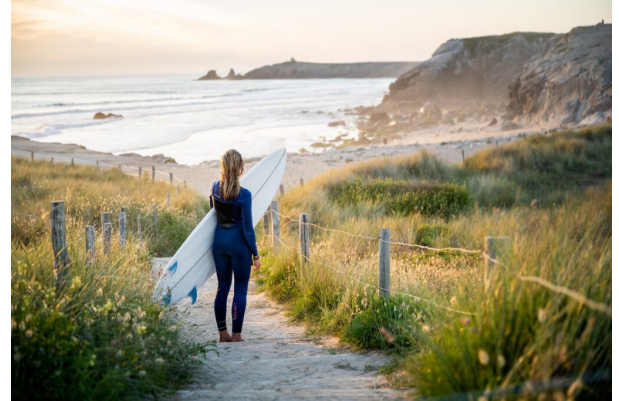
Surf sur la baie de Quiberon (56)

Même si les destinations étrangères attirent les Français, au cours de ce printemps 9 sÃ©jours sur 10 auront lieu en France. Toujours trÃ©s prisÃ©e, la Bretagne s'affiche dans le top 3 des destinations privilÃ©giÃ©es par les FranÃ§ais avec 14% des intentions de sÃ©jours prÃ©vus sur notre territoire. Les intentions de dÃ©part se concentrent sur le week-end de pÃªques et les vacances de printemps. En Bretagne, les sÃ©jours seront courts (4,2 jours en moyenne comme au niveau national) et plutÃ´t orientÃ©s vers le littoral (57% des sÃ©jours et 26% Ã la campagne). Deux tiers des sÃ©jours auront lieu en hÃ©bergements marchands, notamment en hÃtel (20%) ou en location (18%). Alors qu'1 sÃ©jour sur 5 aura lieu dans la famille ou chez les amis.