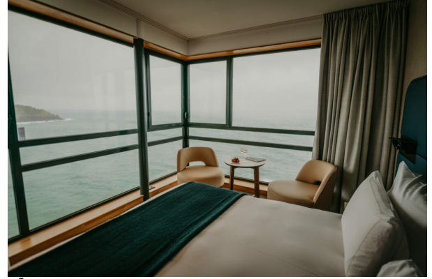
HÃ©tel Ste Barbe Le Conquet – Chambre

OÃ¹ dormir : HÃ©tel Sainte-Barbe A partir de 179 â? la nuit pour 2 pers.